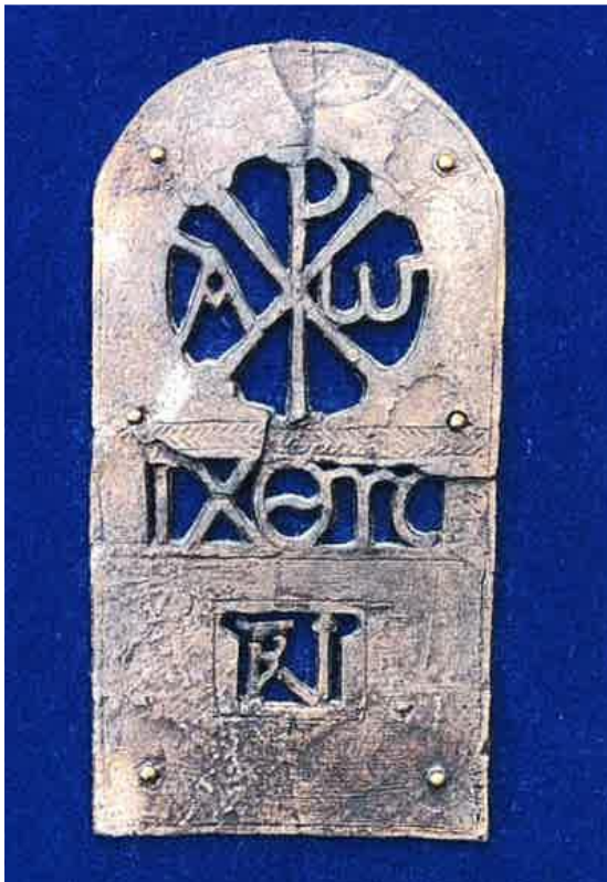
Beschlag vom Sarg des Trierer Bischofs Paulinus ( + 358)

vom 07. November bis zum 29. November 2020